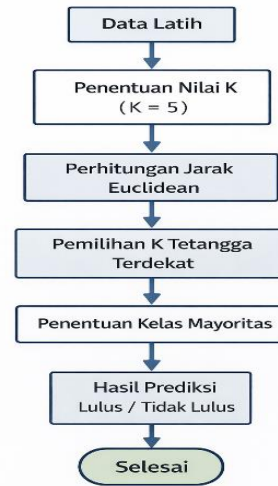
Gambar 2 Diagram Proses Klasifikasi Metode K-Nearest Neighbor

terdekat tersebut digunakan sebagai dasar dalam menentukan hasil prediksi kelulusan mahasiswa, yaitu lulus atau tidak lulus.